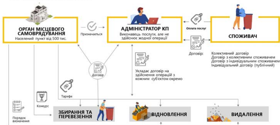
Мал.2. Система організації управління побутовими відходами у разі наявності адміністратора.