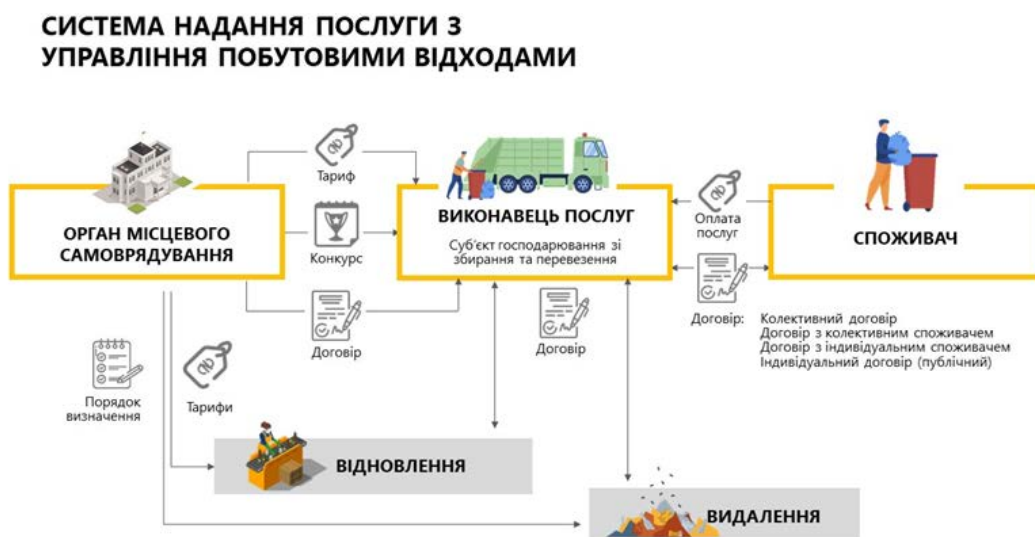
Мал.1. Система організації управління побутовими відходами у разі відсутності адміністратора.

Зазначимо, що з метою спрощення реалізації органами місцевого самоврядування норм Закону України «Про управління відходами», Міністерством розвитку громад, територій та інфраструктури України розроблено інформаційно-графічні матеріали. Зазначені матеріали доступно ілюструють основні нововведення Закону в частині реалізації органами місцевого самоврядування повноваження у галузі управління побутовими відходами, а саме: