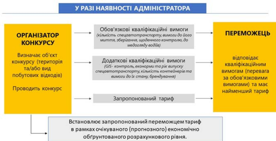
Мал.4 Механізм проведення конкурсу на здійснення операцій зі збирання та перевезення побутових відходів у разі наявності адміністратора.