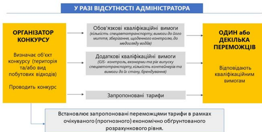
Мал.3. Механізм проведення конкурсу на здійснення операцій зі збирання та перевезення побутових відходів у разі відсутності адміністратора.