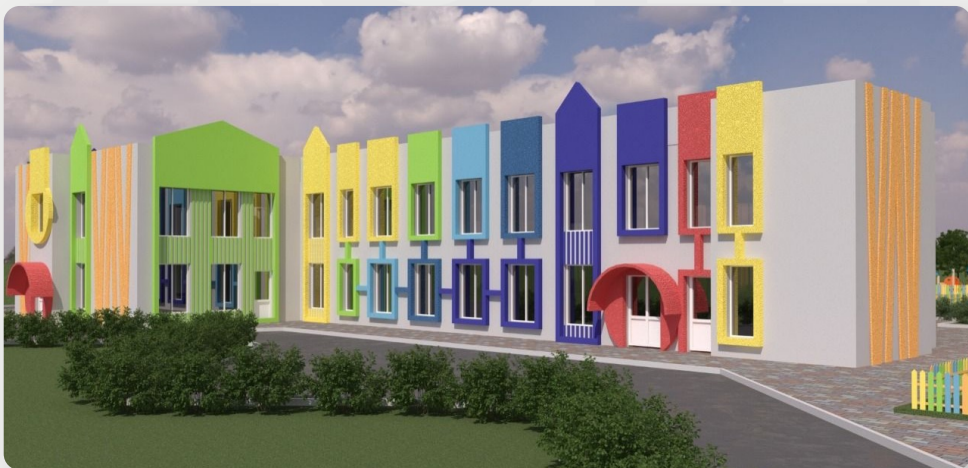
ЗДО, смт Гришківці, Житомирська обл. (проект ОДА)