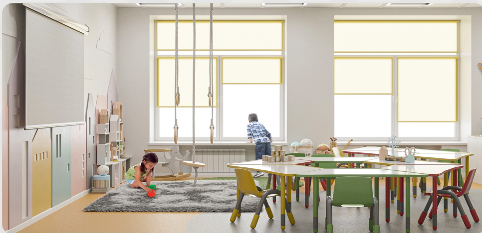
ЗДО №99 «Зірочка», м. Мелітополь, Запорізька обл. (проект ОДА)