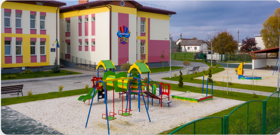
ЗДО, с. Зимна Вода, Львівська обл.