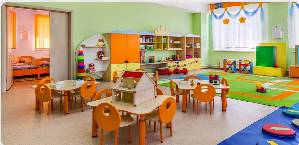
ЗДО «Ромашка», с. Северинівка, Вінницька обл. (проект ОДА)