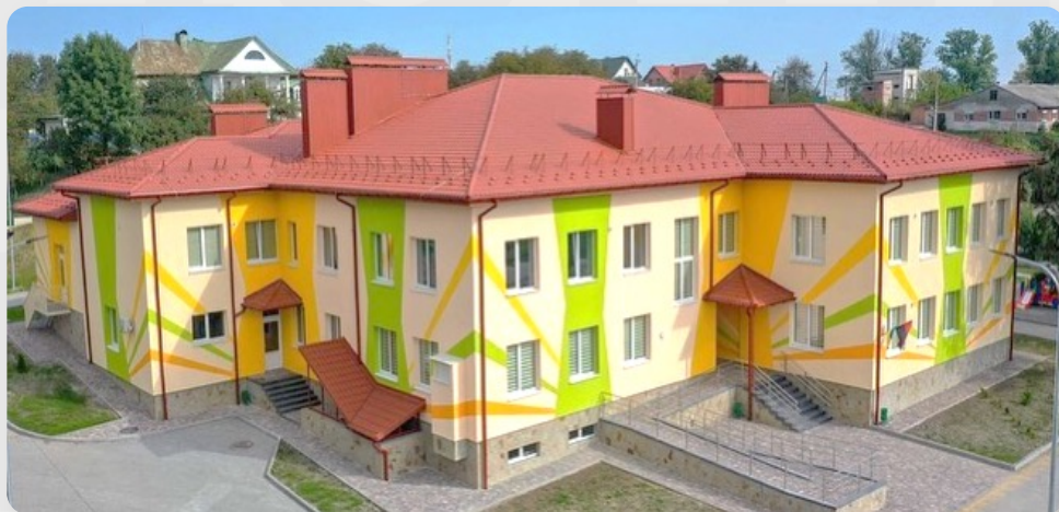
ЗДО, с. Борщовичі, Львівська обл.