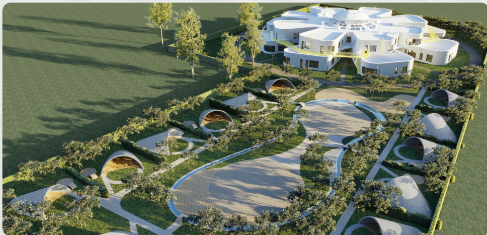
ЗДО, м. Миколаїв (проект ОДА)