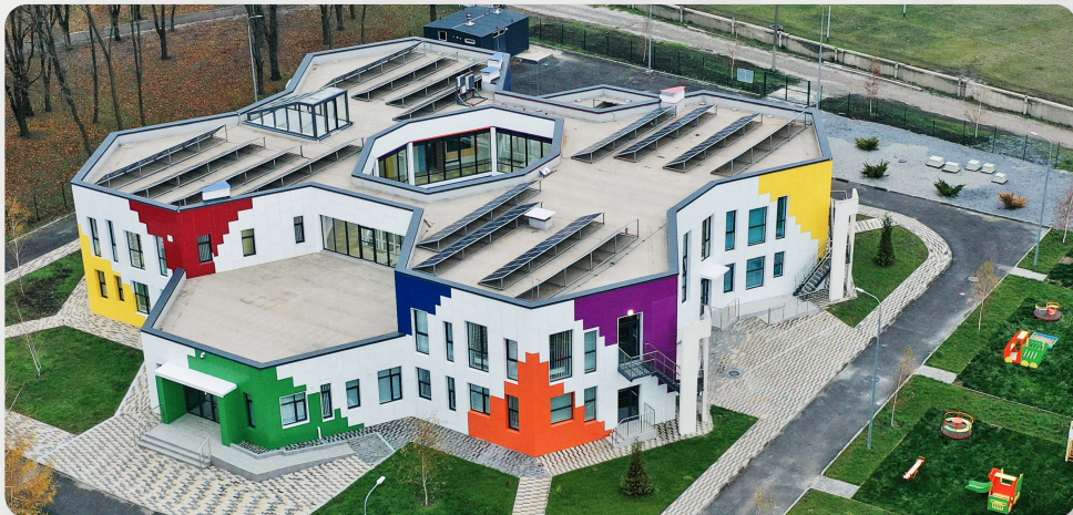
ЗДО, смт Іларіонове, Дніпропетровська обл.