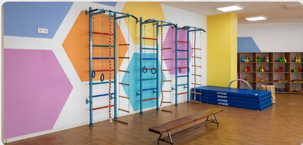
ЗДО, смт Іларіонове, Дніпропетровська область