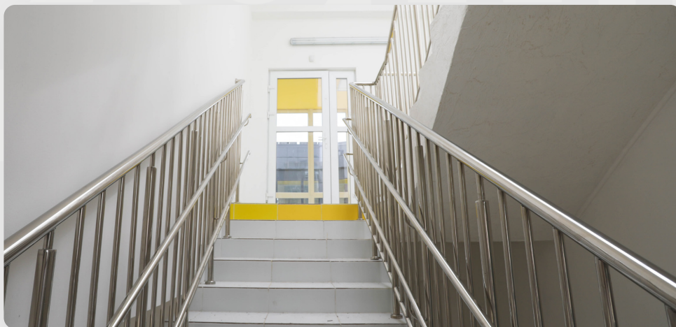
ЗДО, смт Романкове, Дніпропетровська обл.