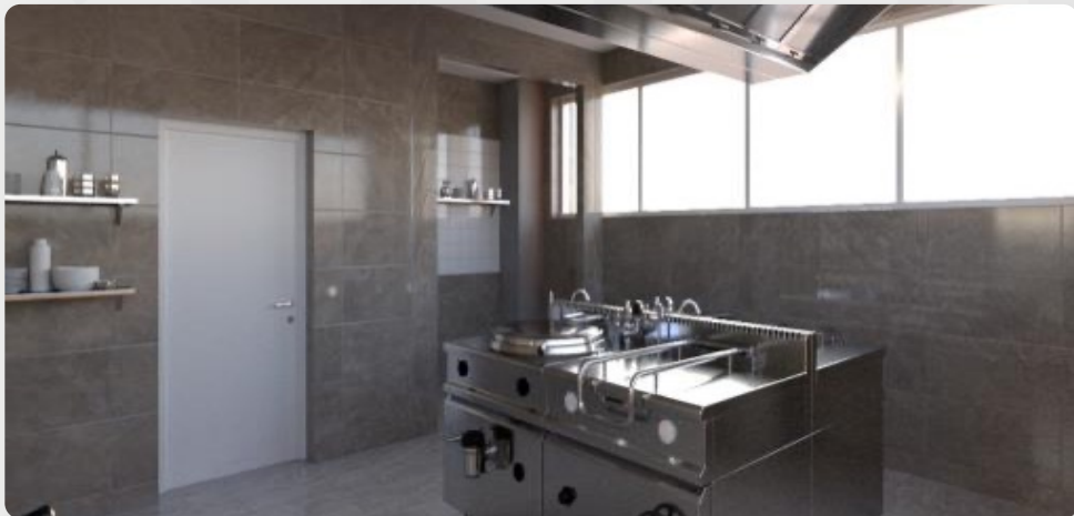
ЗДО «Колосок», Харківська обл. (проект ОДА)