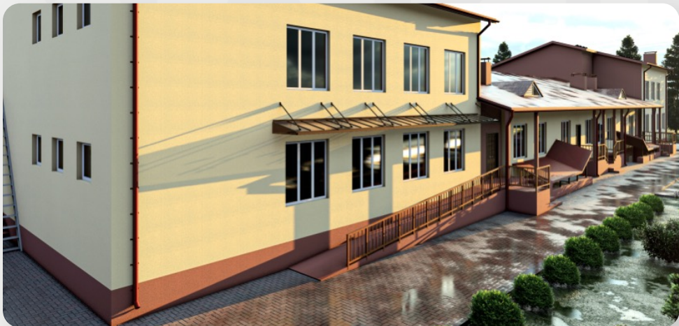
ЗДО, с. Бузаки, Волинська обл. (проект ОДА)