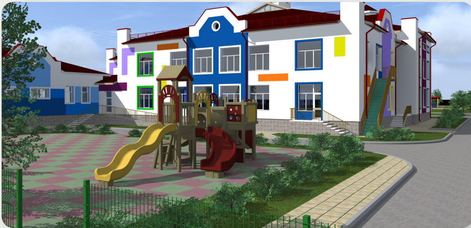
ЗДО, м. Бердичів, Житомирська обл. (проект ОДА)