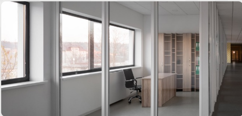
ЗДО, смт Іларіонове, Дніпропетровська область