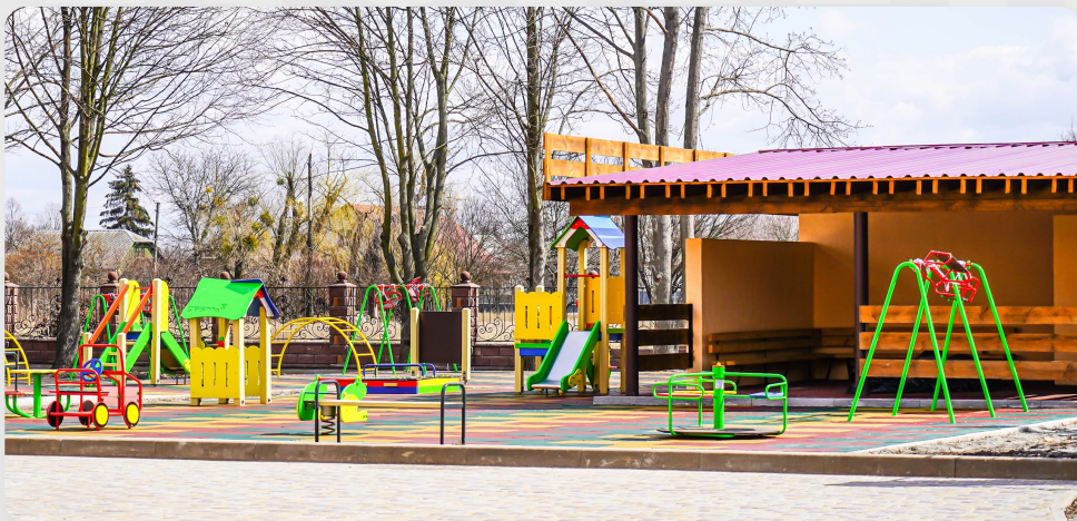
ЗДО, м. Козаровичі, Київська область