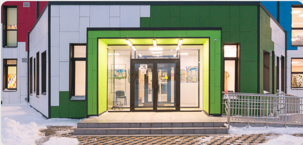
ЗДО, м. Підгородне, Дніпропетровська обл.