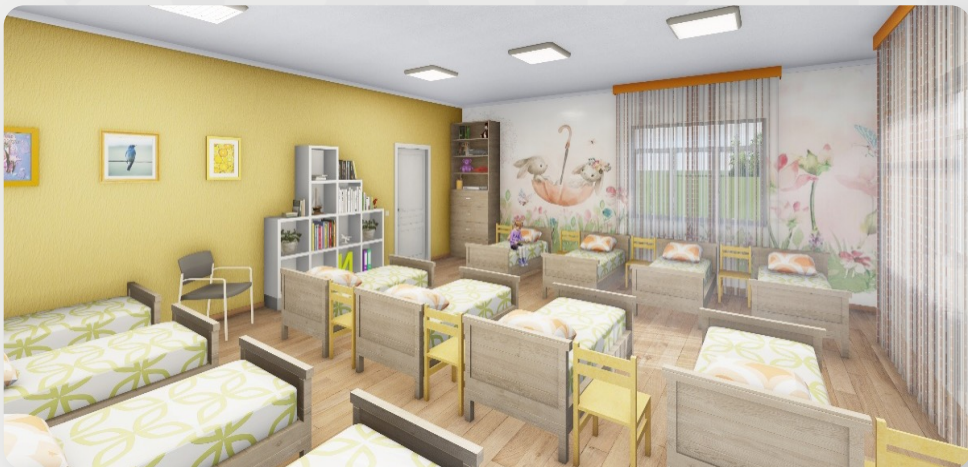
ЗДО «Сонечко», с. Павлівка, Вінницька обл. (проект ОДА)