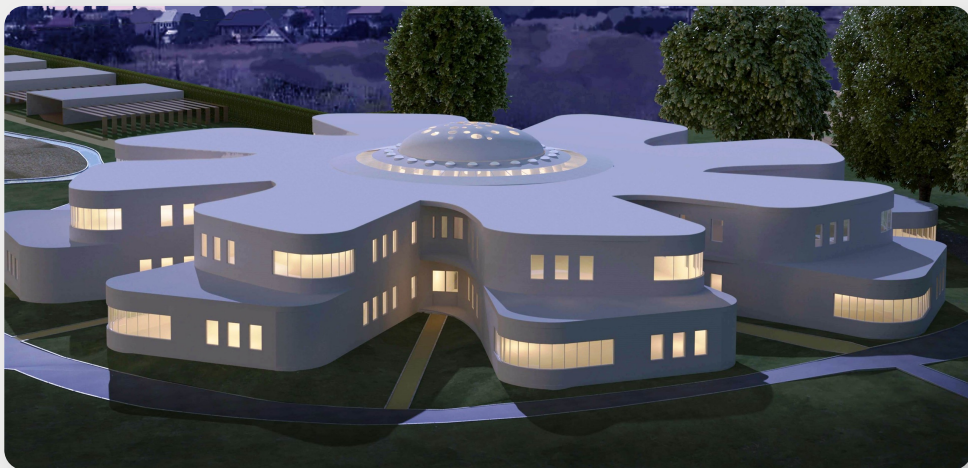
ЗДО, м. Миколаїв (проект ОДА)