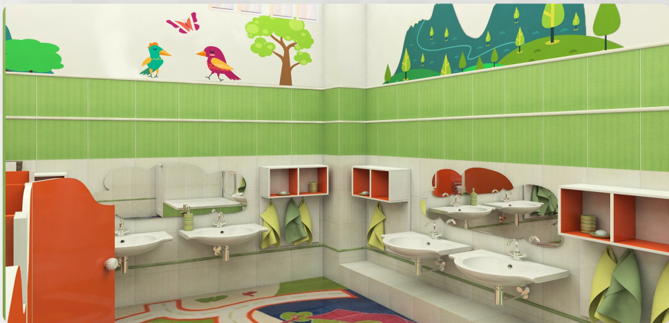
ЗДО, с. Гатне, Київська обл. (проект ОДА)