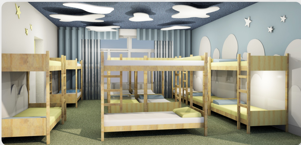
ЗДО №5, м. Могилів-Подільський, Вінницька обл. (проект ОДА)