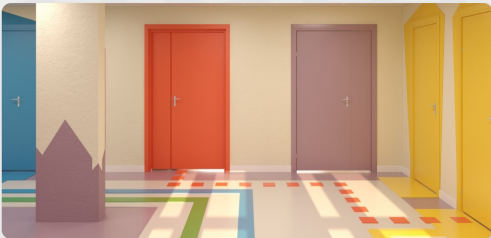
ЗДО, смт Гришківці, Житомирська обл. (проект ОДА)