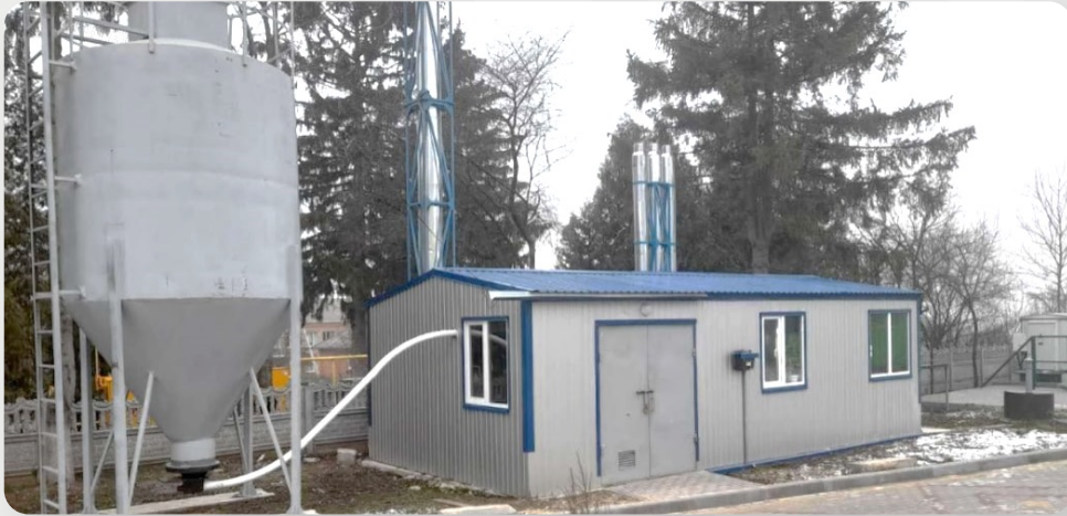
ЗДО, с. Давидківці, Хмельницька обл.