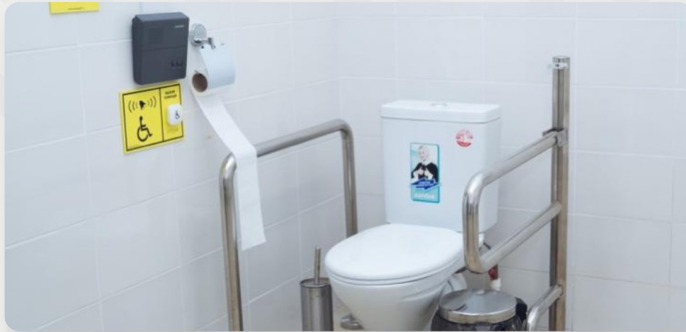
Інклюзивно-ресурсний центр №1, м. Одеса