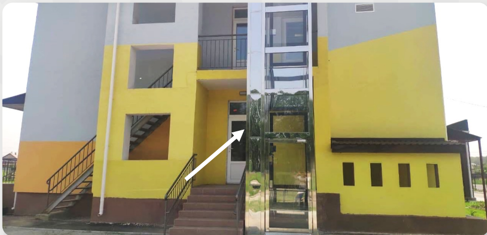
ЗДО «Малятко», с. Станишівка, Житомирська обл.