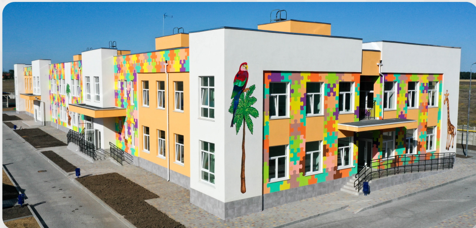
ЗДО, смт Авангард, Одеська обл.