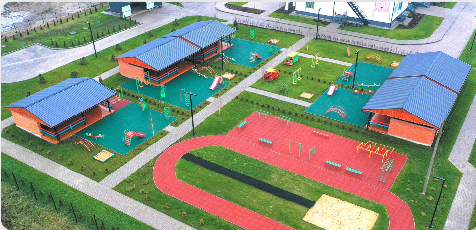
ЗДО, с. Крупа, Волинська область