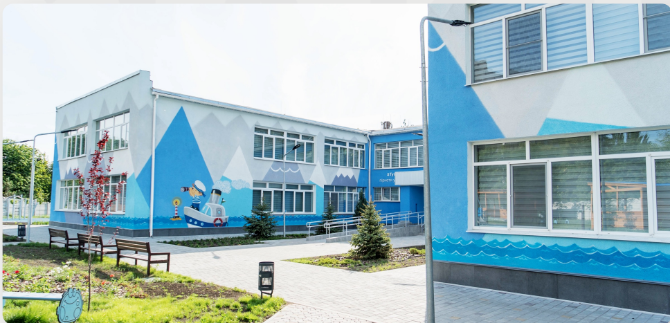
ЗДО №117 «Юний моряк», м. Маріуполь, Донецька обл.