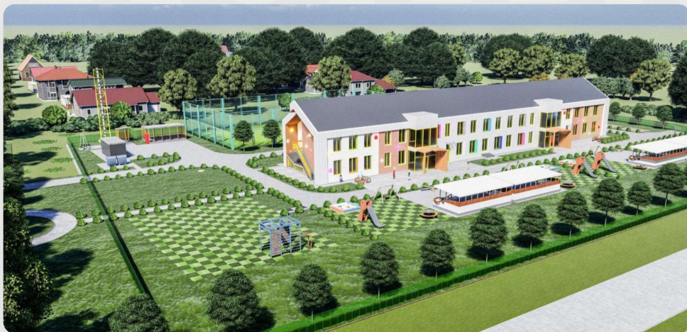
ЗДО, с. Олівка, Житомирська обл. (проект ОДА)