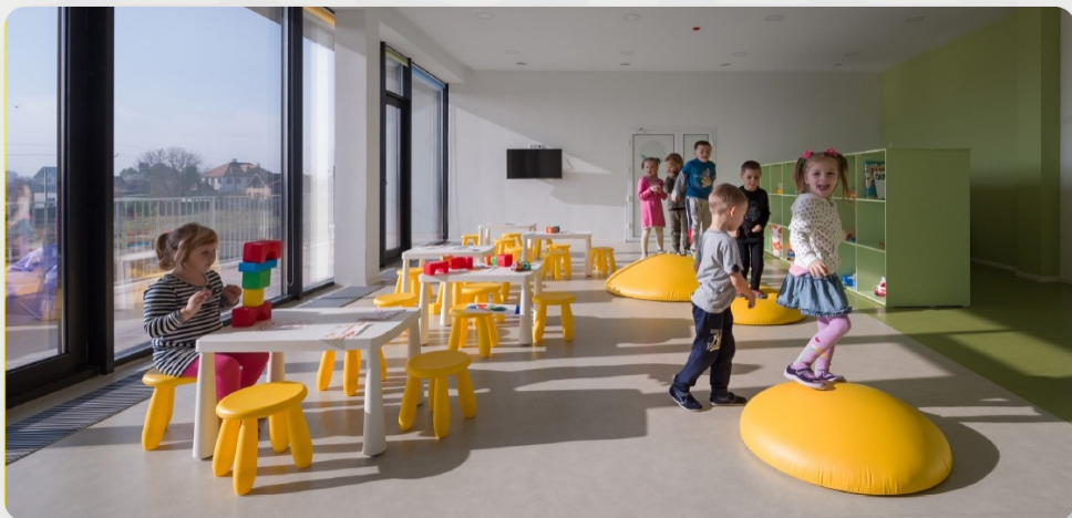
ЗДО, смт Іларіонове, Дніпропетровська обл.