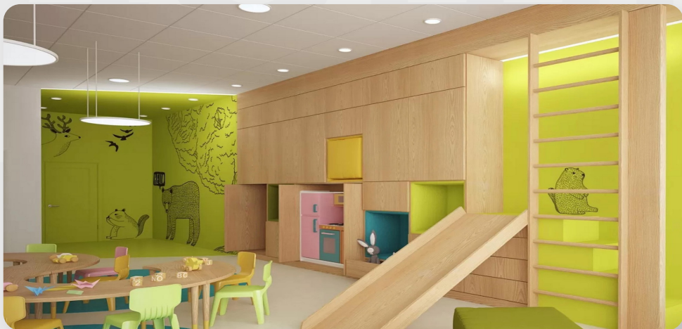
ЗДО №180, м. Кривий Ріг, Дніпропетровська обл. (проект ОДА)