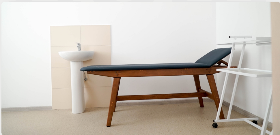
ЗДО, м. Березне, Рівненська область