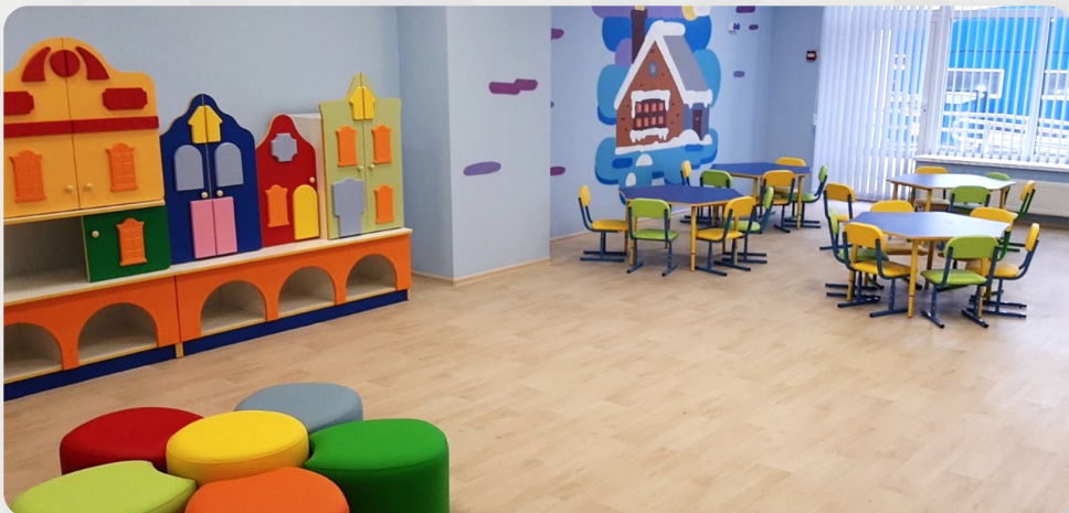
ЗДО, с. Крижанівка, Одеська обл.