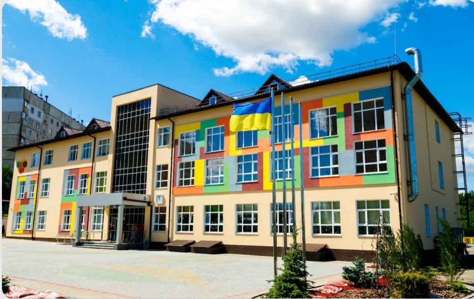
НВК, с. Пісочин, Харківська обл.

Для підвищення енергоефективності будівлі дошкільного закладу освіти необхідно здійснити ряд інженерно-технічних заходів: