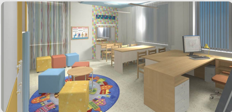
Проект кабінету логопеду в ЗДО