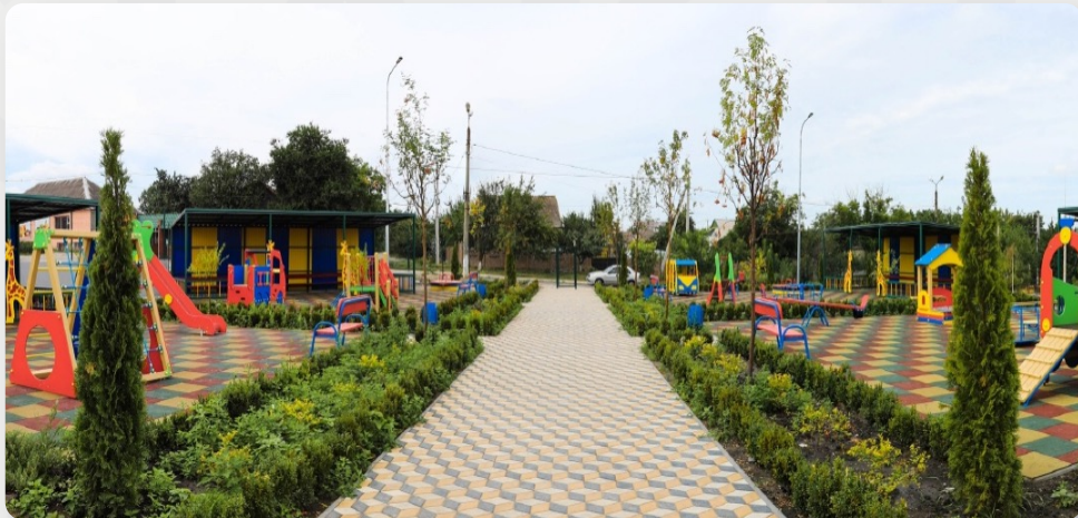
ЗДО, смт Іларіонове, Дніпропетровська область