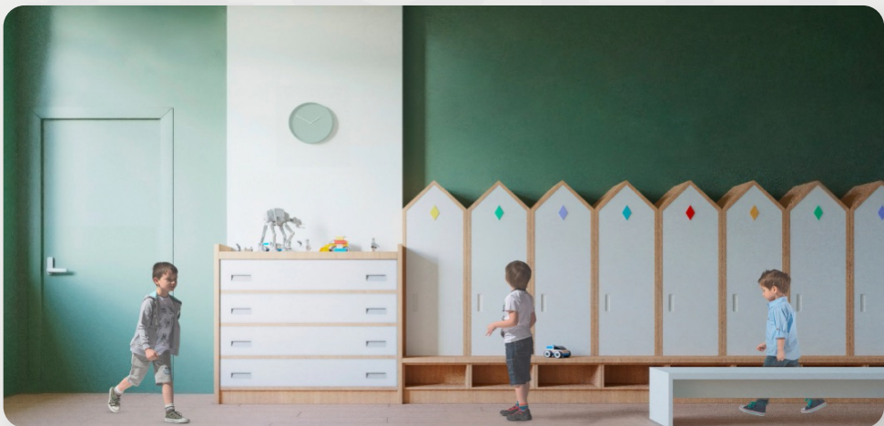
ЗДО №60, м. Кривий Ріг, Дніпропетровська обл. (проект ОДА)