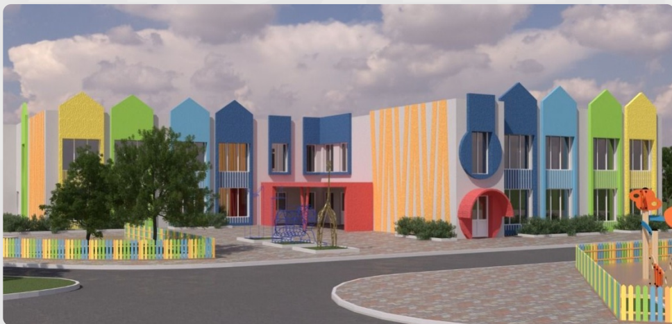
ЗДО, смт Гришківці, Житомирська обл. (проект ОДА)