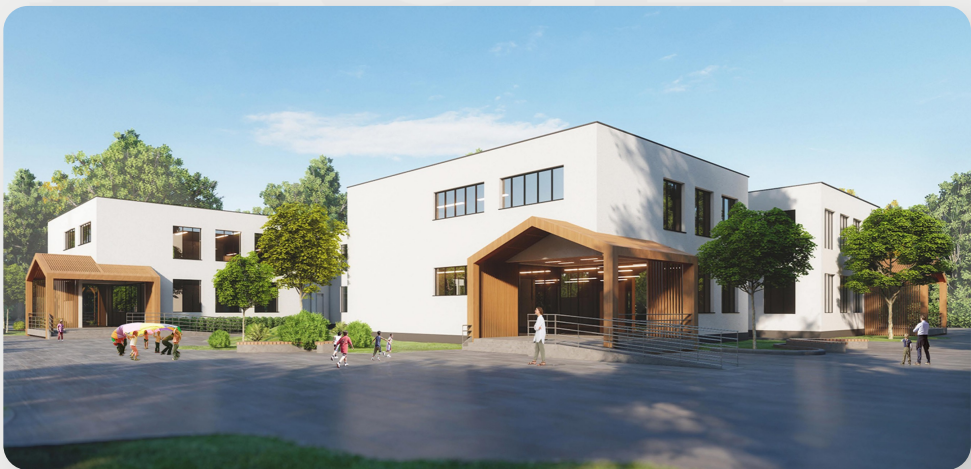
ЗДО № 295, м. Кривий Ріг (проект ОДА)