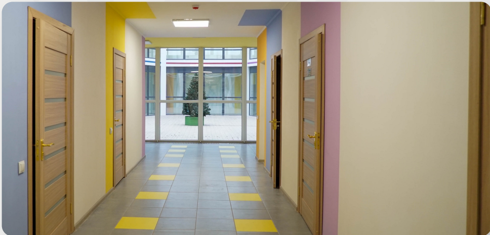
ЗДО, смт Іларіонове, Дніпропетровська обл.