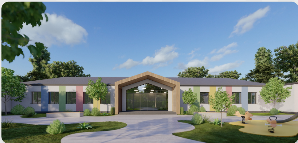
ЗДО, смт Нововасилівка, Запорізька обл. (проект ОДА)