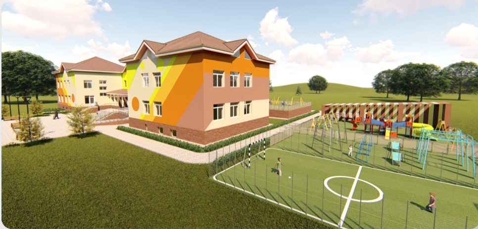
ЗДО, с. Карапчів, Чернівецька обл. (проект ОДА)