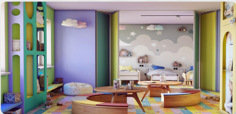
ЗДО, смт Березине, Одеська обл. (проект ОДА)