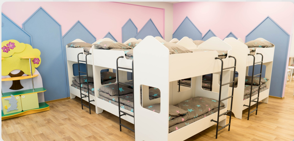
ЗДО №117 «Юний моряк», м. Маріуполь, Донецька обл.