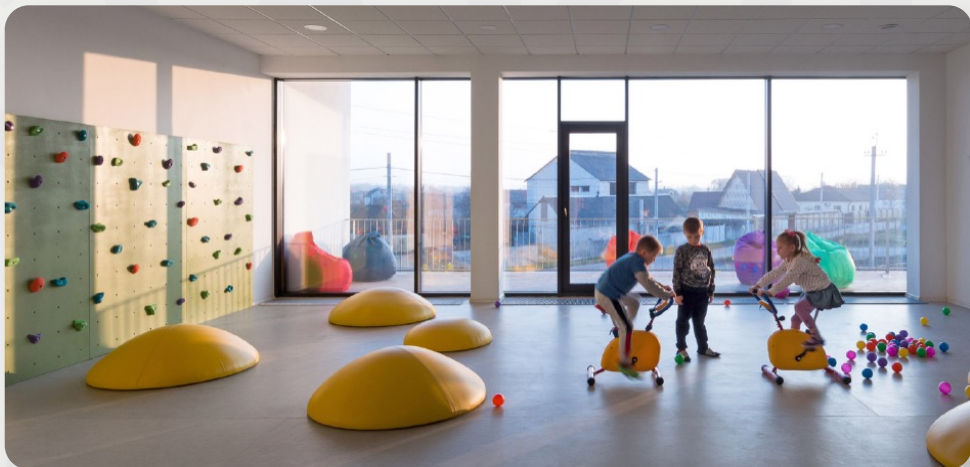
ЗДО, смт Іларіонове, Дніпропетровська обл.