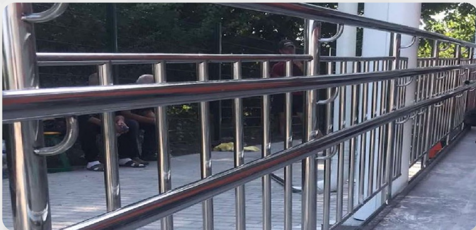
ЗДО, с. Вільне, Дніпропетровська обл.