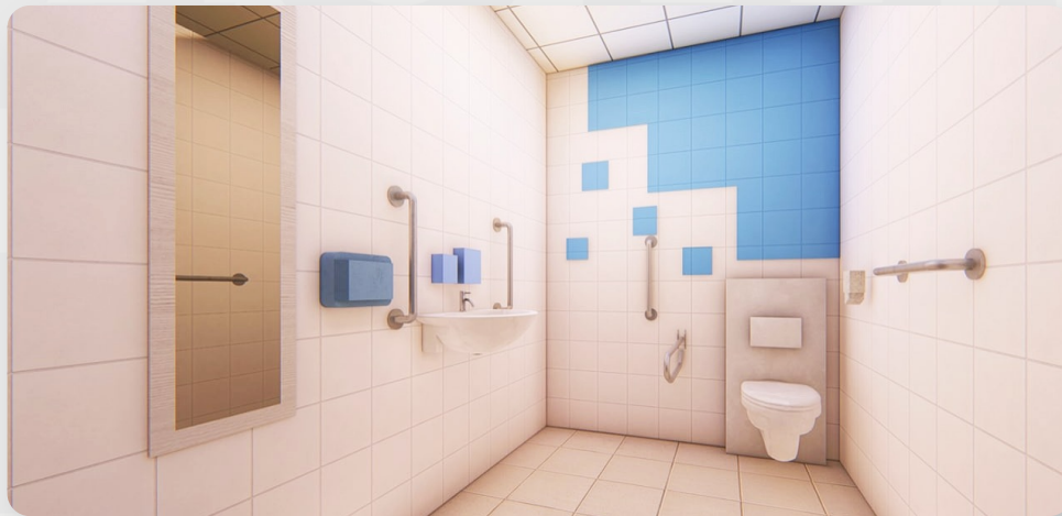
ЗДО, м. Очаків, Миколаївська обл. (проект ОДА)