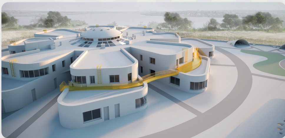
ЗДО, м. Миколаїв (проект ОДА)