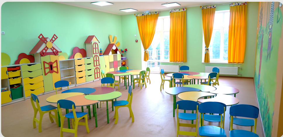
ЗДО, смт Овідіополь, Одеська обл.