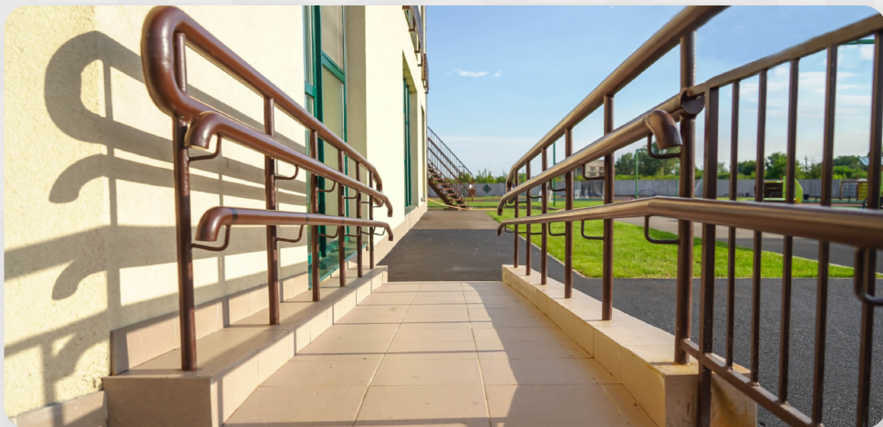
ЗДО, м. Покров, Дніпропетровська обл.