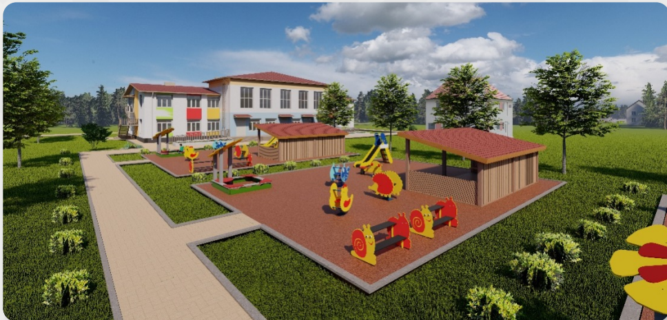
ЗДО «Сонечко», с. Павлівка, Вінницька обл. (проект ОДА)