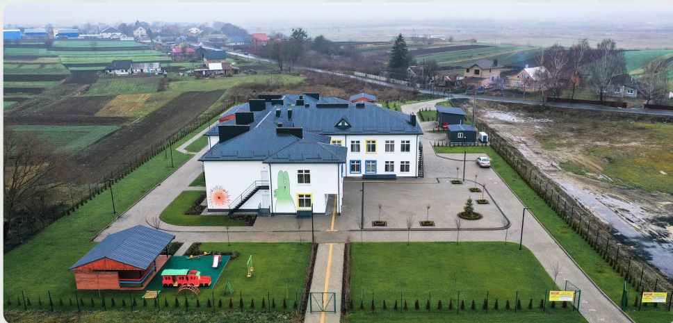
ЗДО, с. Крупа, Волинська область