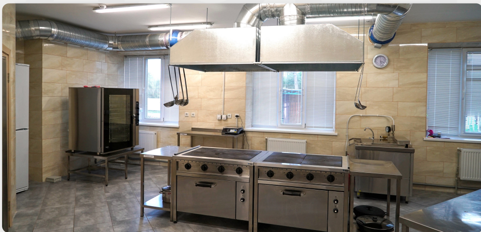
ЗДО, м. Ірпінь, Київська обл.