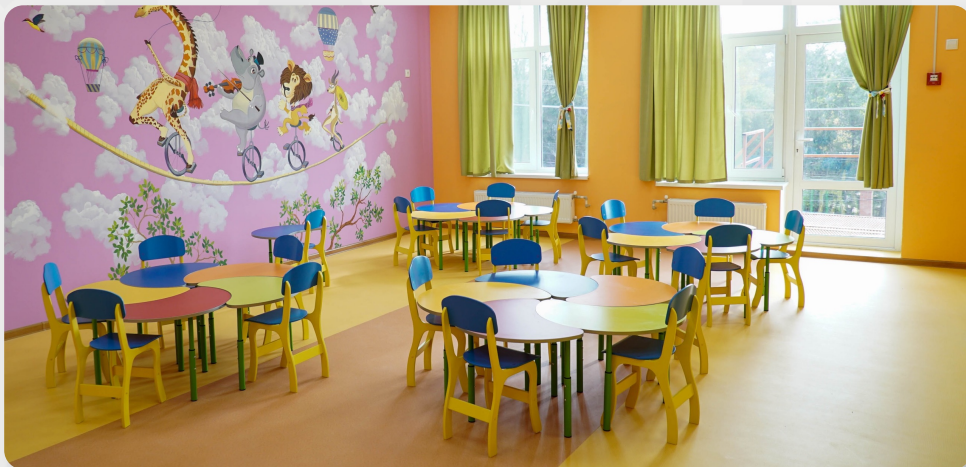
ЗДО, смт Овідіополь, Одеська обл.