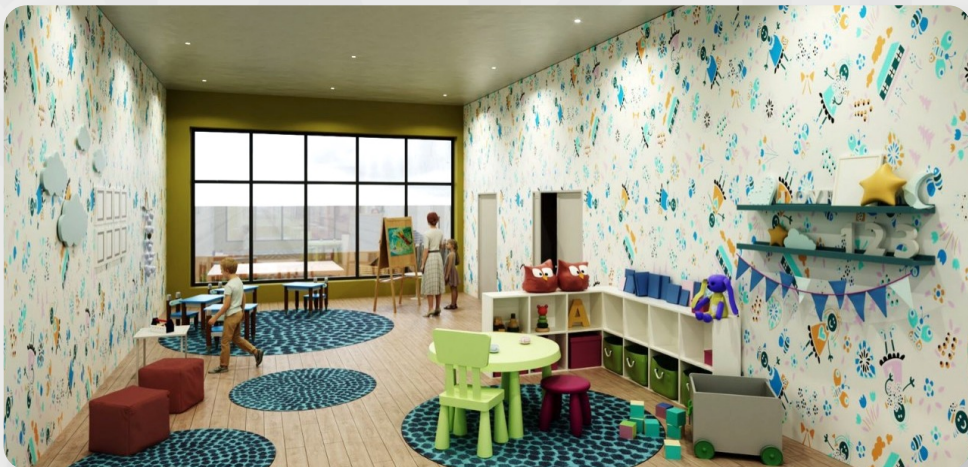
ЗДО №1, м. Запоріжжя (проект ОДА)