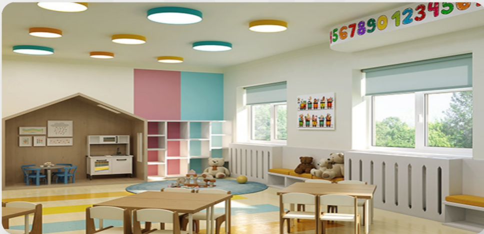
ЗДО, с. Оліївка, Житомирська обл. (проект ОДА)