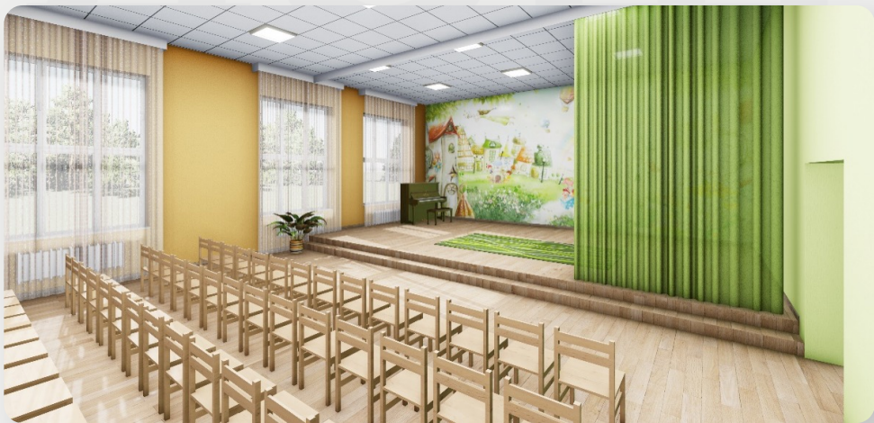
ЗДО «Сонечко», с. Павлівка, Вінницька обл. (проект ОДА)