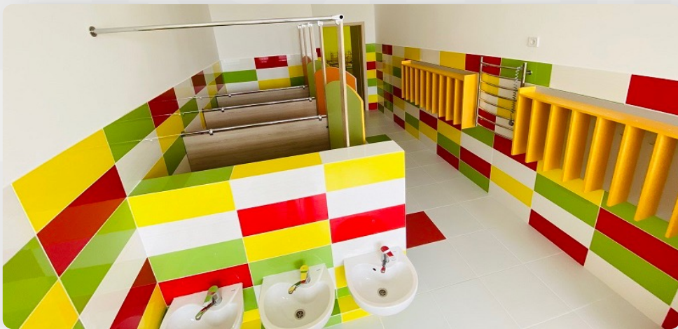
ЗДО, м. Березне, Рівненська обл.