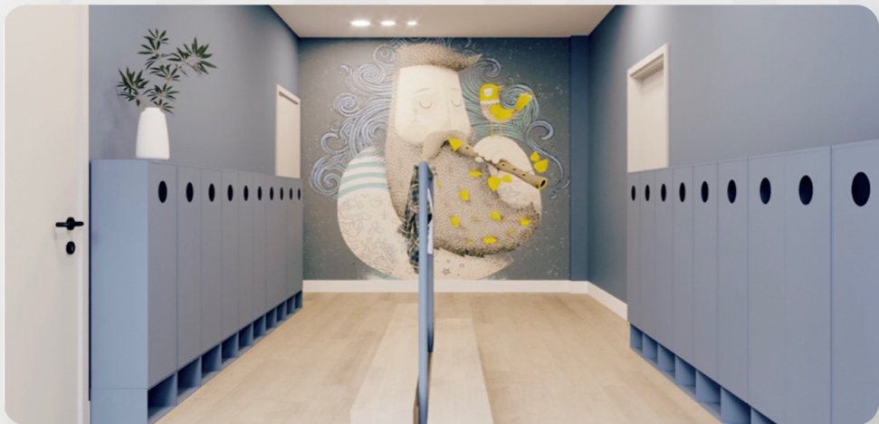
ЗДО, м. Миколаїв (проект ОДА)