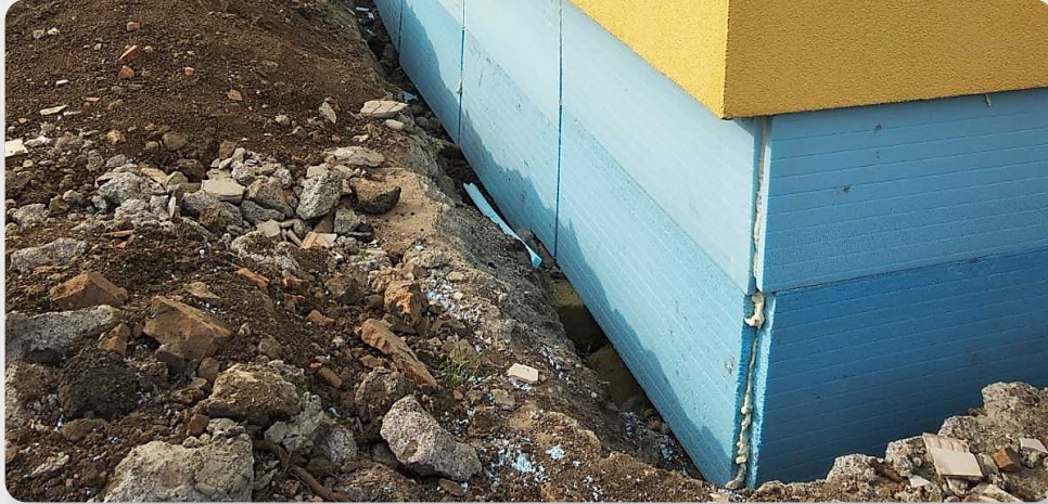
ЗДО, смт. Теплик, Вінницька обл.