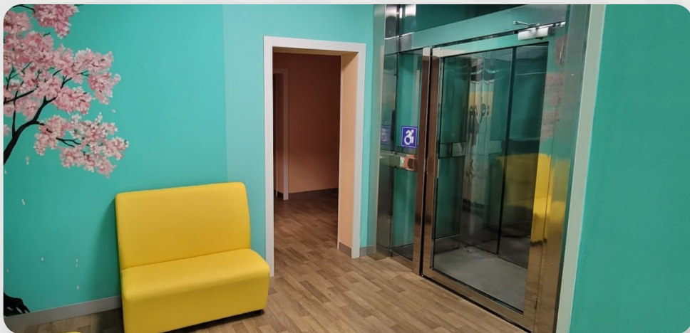
Центр реабілітації дітей, м. Маріуполь