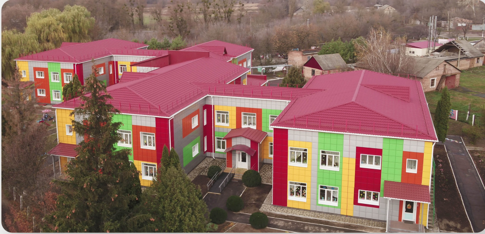
ЗДО, м. Лохвиця, Полтавська обл.