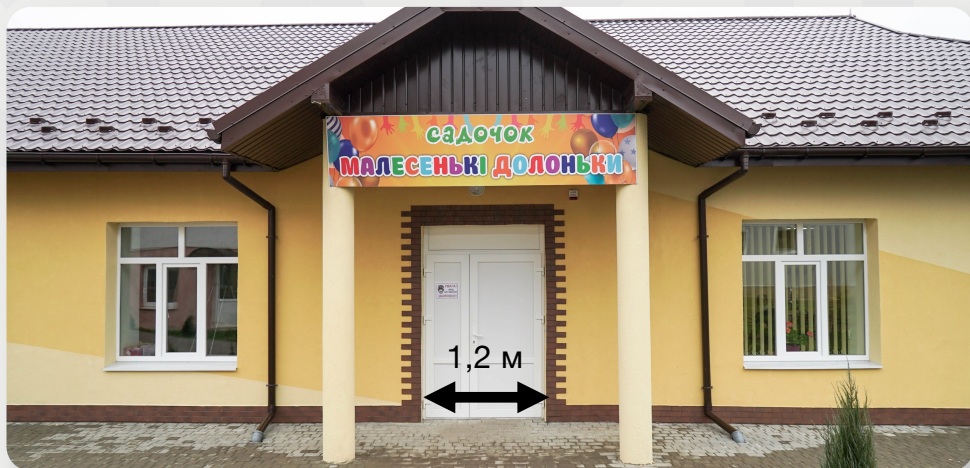
ЗДО, с. Марківка, Івано-Франківська обл.