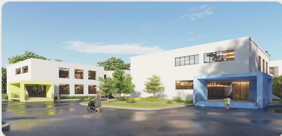
ЗДО № 201, м. Кривий Ріг, Дніпропетровська обл. (проект ОДА)