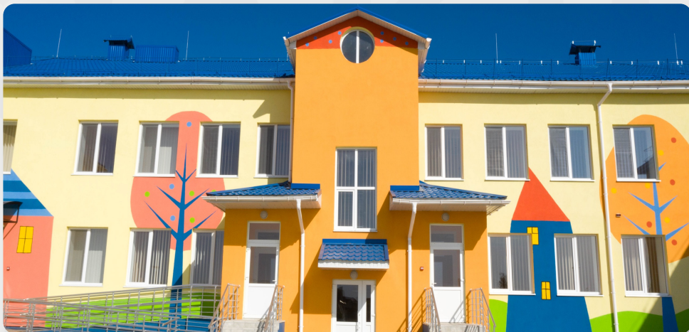
ЗДО, м. Березне, Рівненська обл.