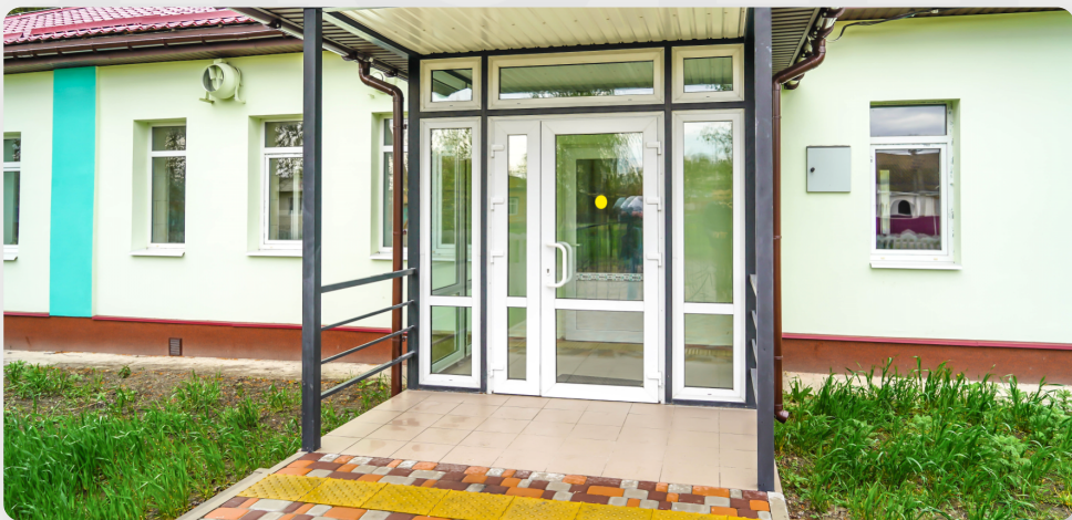
ЗДО, с. Ніжинське, Чернігівська обл.