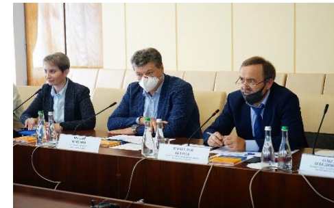
28.08.2020 м. Житомир

4 серпня 2020 року всеукраїнська онлайн-нарада з питань територіальної організації влади щодо повноважень, структури та чисельності місцевих державних адміністрацій за участю ЦОВВ, МДА, ОПУ, СКМУ, експертів