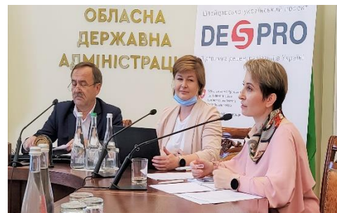
18.08.2020 м. Чернігів