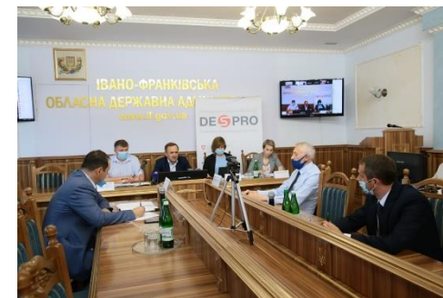
13.08.2020 м. Ів Франківськ