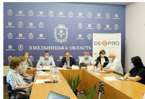
12.08.2020 м. Хмельницький