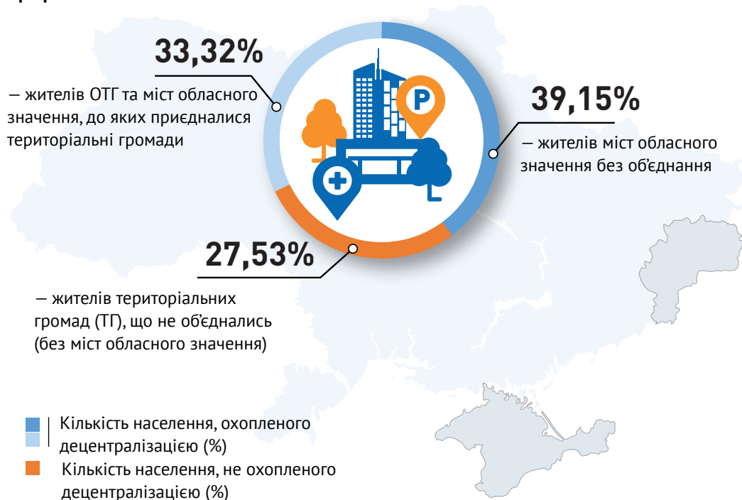
Графік 2. Населення

В той же час залишаються розбіжності щодо кількісної оцінки створення ОТГ. Приміром, прихильники децентралізації вказують на статистичні дані Міністерства розвитку громад та територій, які показують, що понад 70% населення