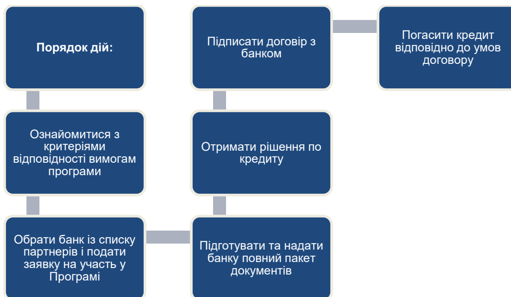
Рис.12. Алгоритм надання кредиту ММСП України за пріоритетними галузевими напрямками