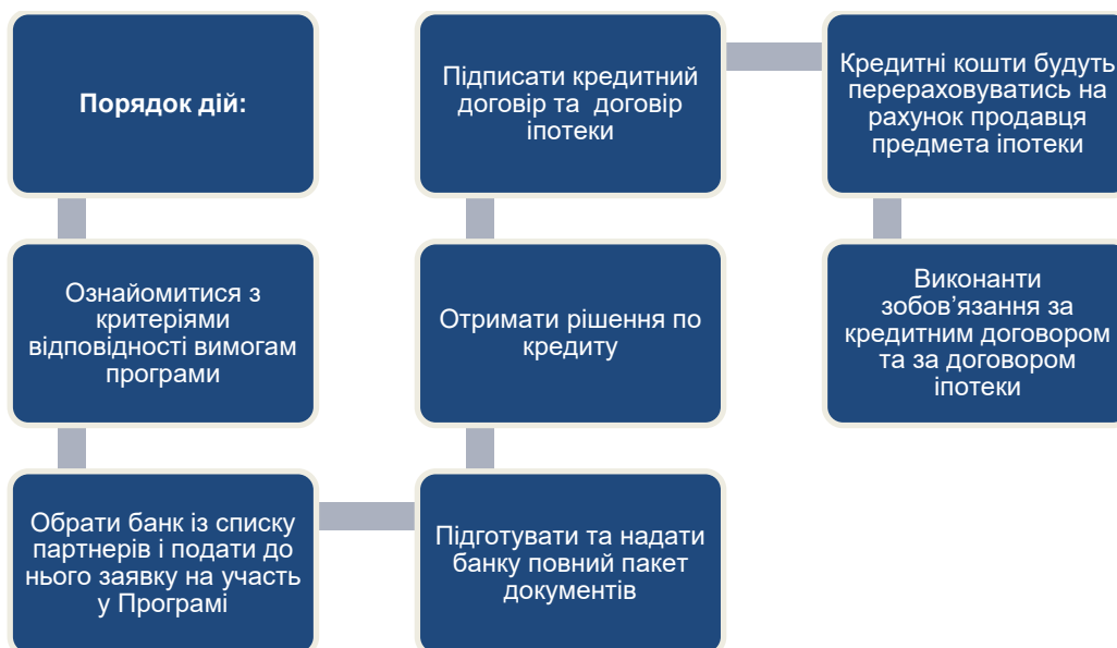
Рис.7. Алгоритм надання фінансової державної підтримки за договорами іпотеки

Позичальник сплачує проценти за Компенсаційною процентною ставкою протягом всього строку іпотечного кредиту за умови вчасного та у повному обсязі виконання своїх зобов'язань за кредитним договором та за договором іпотеки (іпотечним договором).