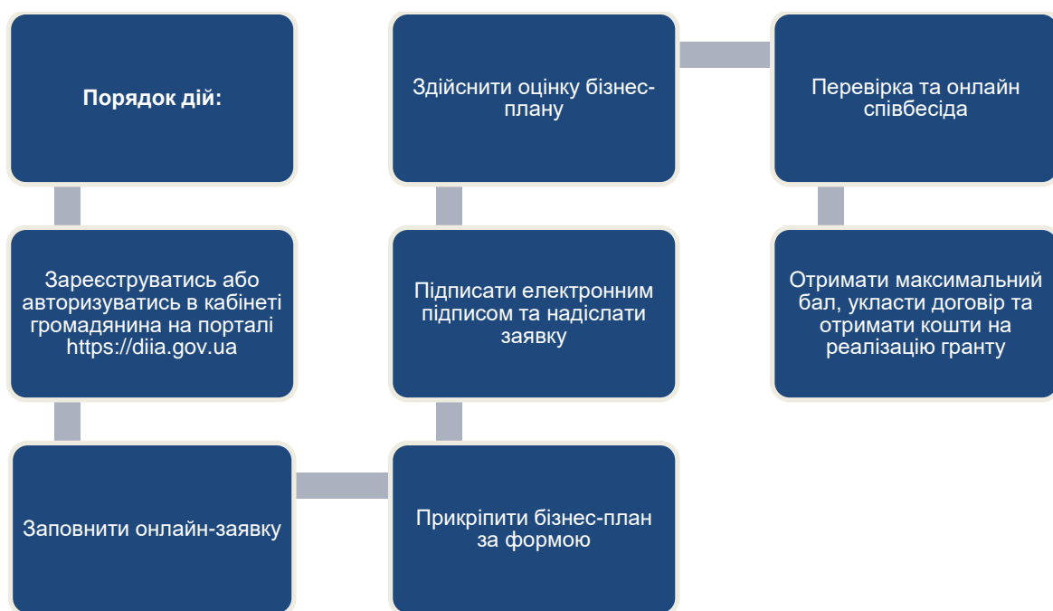
Рис.4. Алгоритм отримання гранту на створення або розвиток переробних підприємств

Рішення про надання гранту приймає Мінекономіки на підставі переліку висновків уповноваженого банку, який включає оцінку бізнес-плану, співбесіди та результати перевірки ділової репутації отримувача.