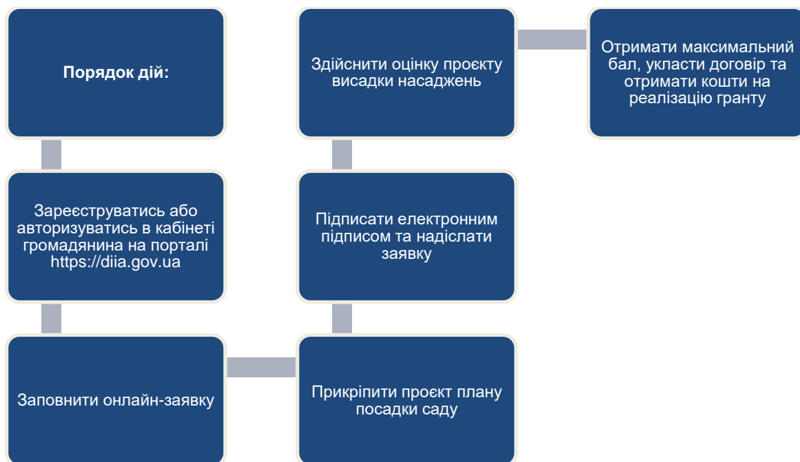
Рис.2. Алгоритм отримання гранту для створення або розвитку садівництва, ягідництва та виноградарства

Рішення про надання гранту приймає Міністерство аграрної політики та промисловості після перевірки заяви уповноваженим банком та розглянувши проєкт висадки насаджень.