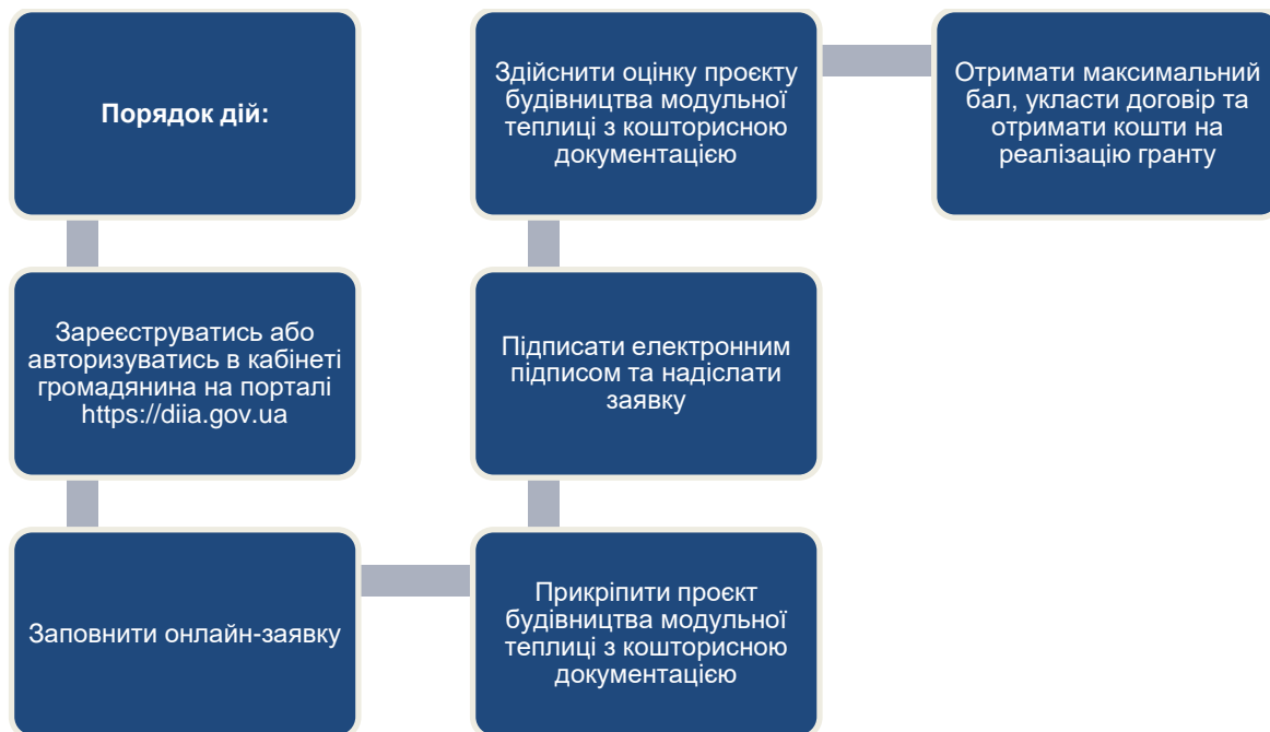
Рис.3 Алгоритм отримання гранту для створення або розвитку тепличного господарства

Рішення про надання гранту приймає Міністерство аграрної політики та промисловості після перевірки заяви уповноваженим банком та розглянувши проект будівництва модульної теплиці з кошторисною документацією.