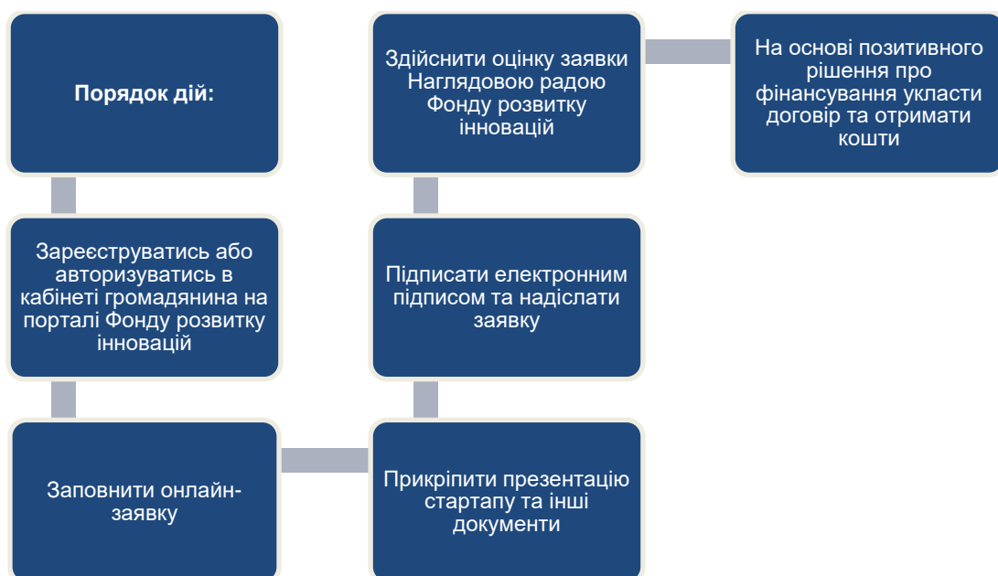
Рис.8. Алгоритм отримання гранту на стартап