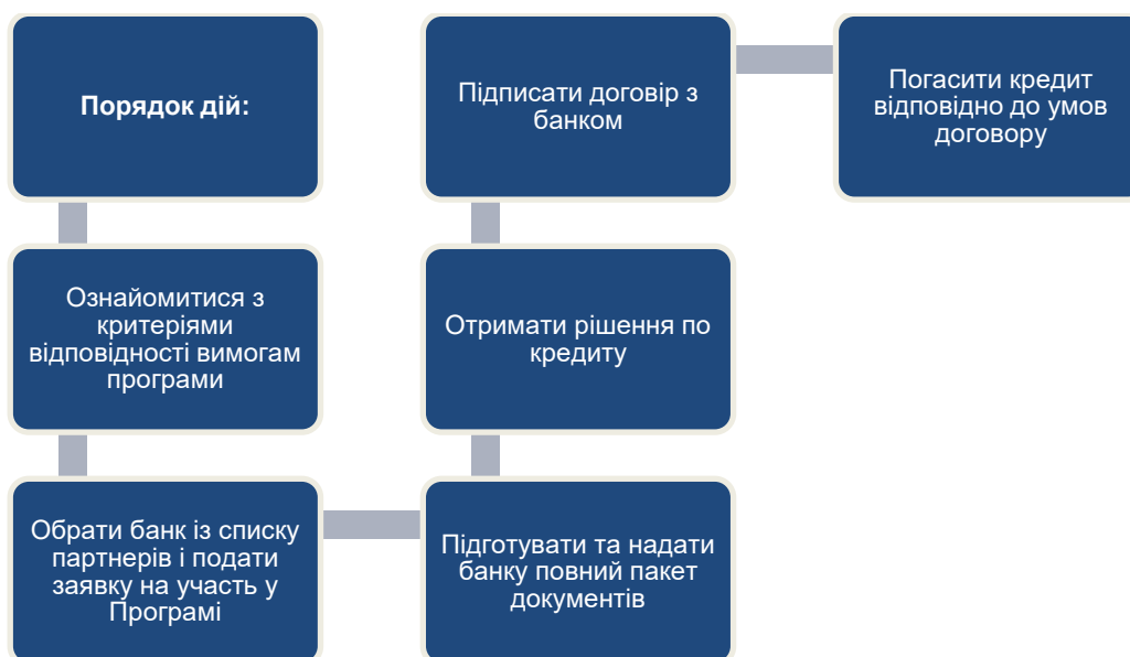
Рис.13. Алгоритм надання кредиту на фінансування інвестиційних проектів МСП за пріоритетними напрямками