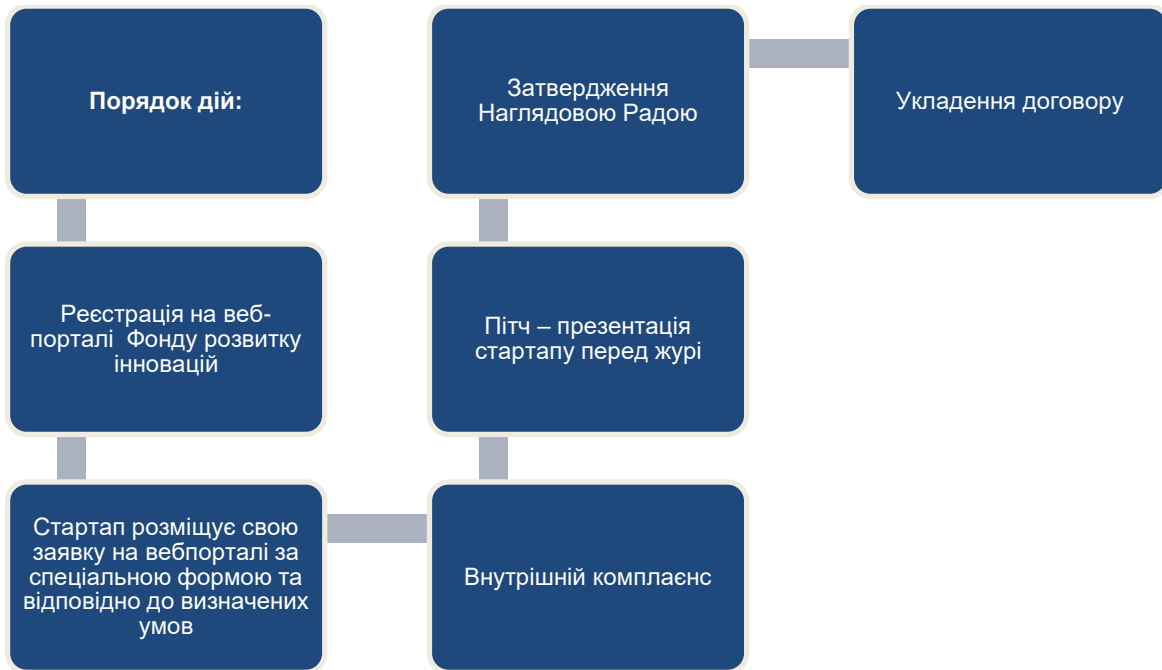
Рис.9. Алгоритм отримання інноваційного ваучеру