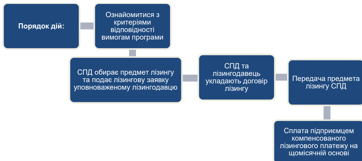
Рис.6. Алгоритм надання фінансової державної підтримки суб'єктам підприємництва за договорами фінансового лізингу

У період дії воєнного стану обмеження суми державної підтримки, визначені підпунктами 4 і 5 цього пункту, не застосовуються.