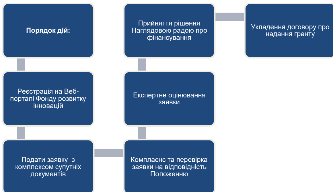
Рис.10. Алгоритм грантової підтримки проєктів подвійного призначення